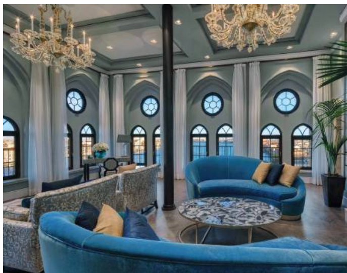
Hilton Molino Stucky Venice | 5*