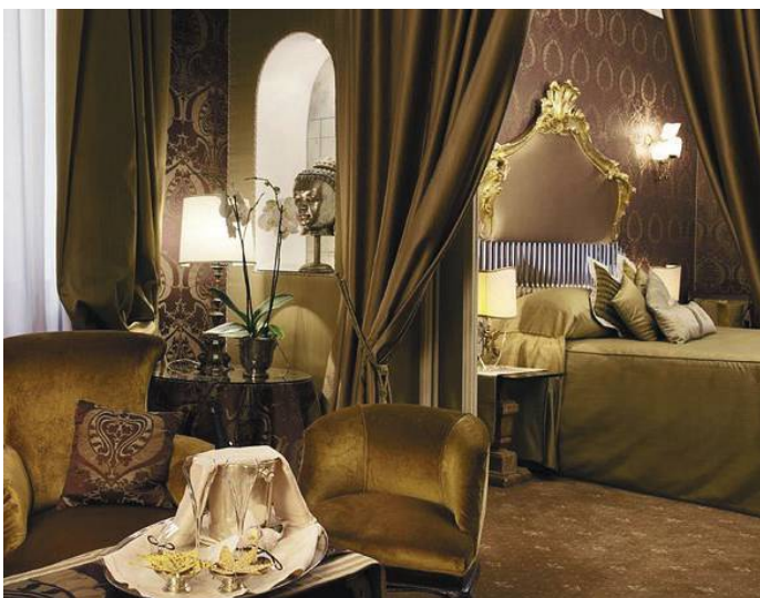
Hotel Metropole Venice | 5*