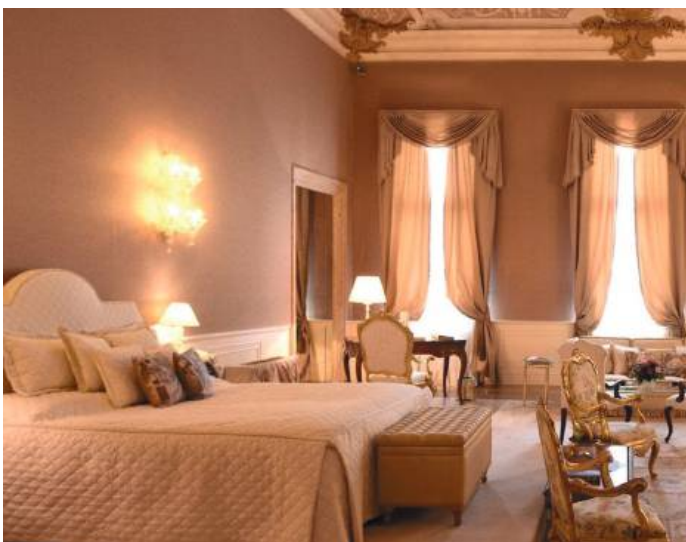
Hotel Ca' Sagredo Venice | 5*