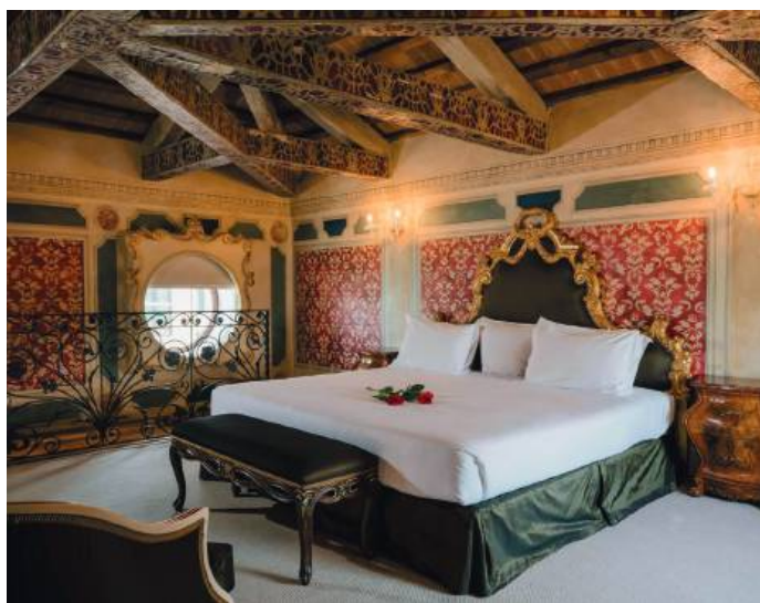
NH Collection Venezia Grand Hotel Palazzo dei Dogi | 5*