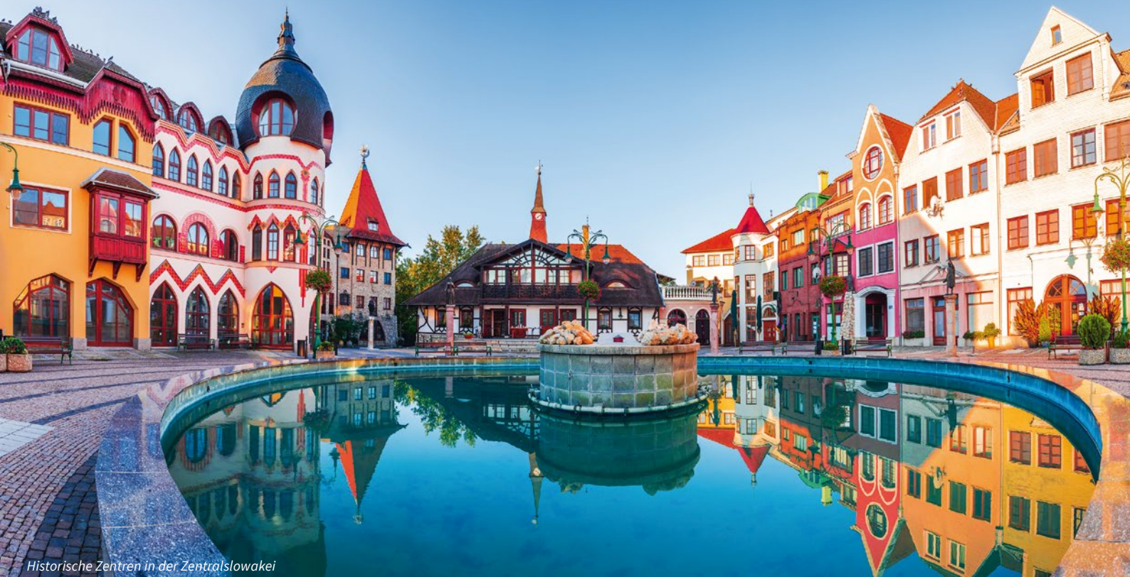
Historische Zentren in der Zentralslowakei

Weiter geht es zum Primatialpalast, dem heutigen Sitz des Primators von Bratislava, mit seinem wunderschönen Spiegelsaal und den Repräsentationsräumen mit einzigartigen englischen Gobelins (1632), Werke der königlichen Webereien in Mortlake bei London, die erst Anfang des 20. Jahrhunderts in einem Versteck entdeckt wurden. Nach einer Erholungspause im Hotel und einem Nachmittagsimbiss fahren wir mit dem Bus zum modernen Gebäude des Slowakischen Nationaltheaters. Hier wird anlässlich des 200. Jahrestages der Geburt von Bedřich Smetana die Oper Hubička (Der Kuss) aufgeführt, welche wir uns nicht entgehen lassen werden. Nach der Oper fahren wir in die nahegelegene malerische Stadt Svätý Júr (St. Georgen) und lassen den Abend bei einem gemütlichen Abendessen im Renaissanceherrenhaus von Katarina Palffy ausklingen. Hier wurde und wird auch heute noch der in der gesamten K&K-Monarchie bekannte Svätôjúr-Wein hergestellt, den wir selbstverständlich zum Essen verkosten werden.