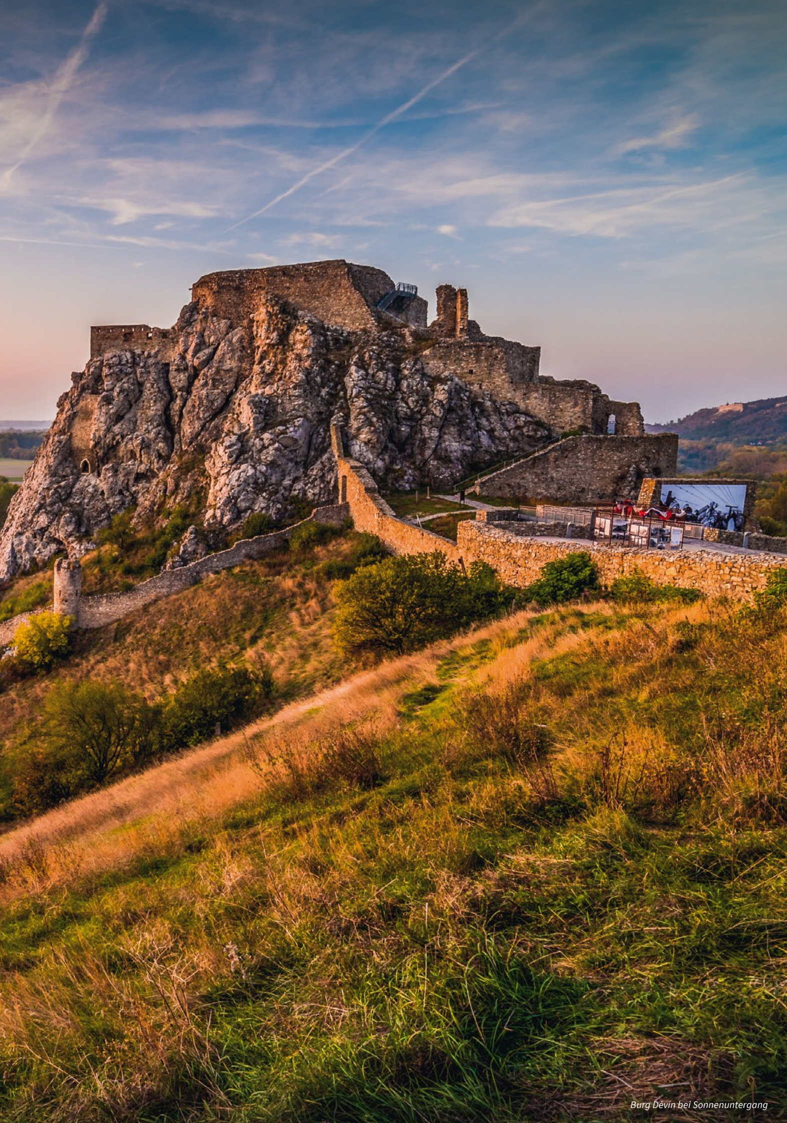
Burg Děvín bei Sonnenuntergang