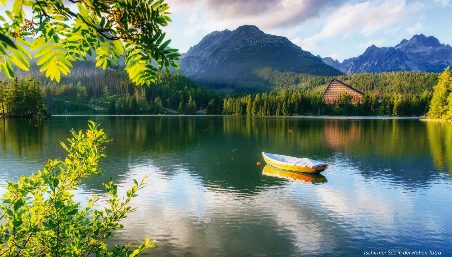
Tschirmer See in der Hohen Tatra