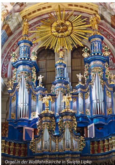
Orgel in der Wallfahrtskirche in Święta Lipka

den Bus. Heute dürfen Sie sich auf einen Tagesausflug unter dem Motto: „Auf den Spuren von Frédéric Chopin“ freuen. Den Auftakt zur Auseinandersetzung mit diesem grossartigen Künstler geben wir mit einer besonderen Führung an Orte, die im Zeichen des berühmten Komponisten stehen. Ein Spaziergang voller Musik und Geschichte wartet auf Sie. Wir beginnen mit dem Besuch der Heiligkreuzkirche, in welcher sich die Urne mit den sterblichen Überresten von Frédéric Chopin befindet. Weiter geht es zur Visitenkirche, wo Chopin einst konzertierte und wir werfen einen Blick auf die Universität, wo die Künstlerfamilie einst gewohnt hat (Aussenbesichtigungen). Weiter geht es ins nahegelegene Chopin-Museum im Ostrogski Schloss, welches montags normalerweise geschlossen ist. Exklusiv für uns öffnet das Museum heute seine Pforten. Tauchen Sie im Rahmen einer Führung in die Welt von Chopin ein und gewinnen Sie einen Einblick in das Leben und Wirken des Komponisten. Selbstverständlich soll heute auch die Musik dieses Ausnahmekünstlers erklingen. Im historischen Keller des Ostrogski-Schlusses dürfen Sie sich auf ein privates Klavier-