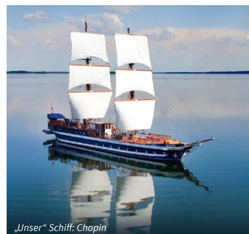
„Unser“ Schiff: Chopin