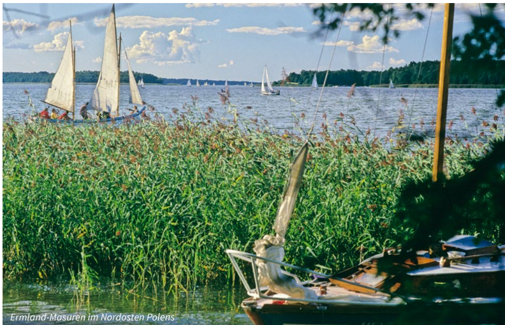
Ermland-Masuren im Nordosten Polens

Nach einem gemütlichen Frühstück im Hotel Check-out und verladen des Reisegepächs in