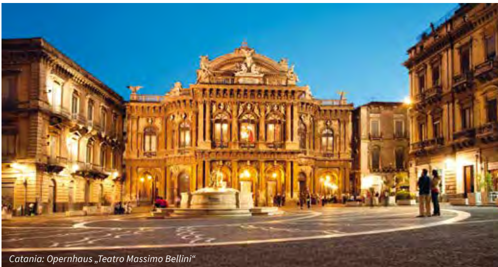
Catania: Opernhaus „Teatro Massimo Bellini“

Die Völker, die Siziliens Antike mit majestätischen Tempeln und Theatern bereicherten, hatten auch ein Händchen für die richtige Location. Ganz deutlich wird das bei unserem heutigen Ausflug nach Agrigento. Ein Besuch im archäologischen Park Valle dei Templi (Tal der Tempel) in Agrigento gehört zu den Höhepunkten einer jeden Sizilienreise. Die Anlage umfasst 1.300 Hektar und ist somit die grösste dieser Art auf der Welt. Das archäologische Gebiet des Tals der Tempel beherbergt insgesamt 8 Tempel, von denen einige sehr gut erhalten sind. 1997 erklärte die UNESCO die archäologischen Stätten