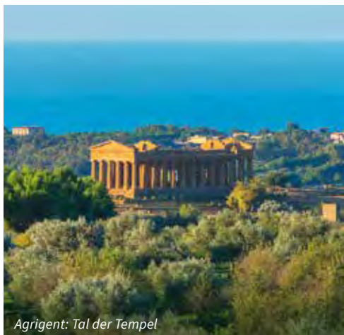
Agrigent: Tal der Tempel