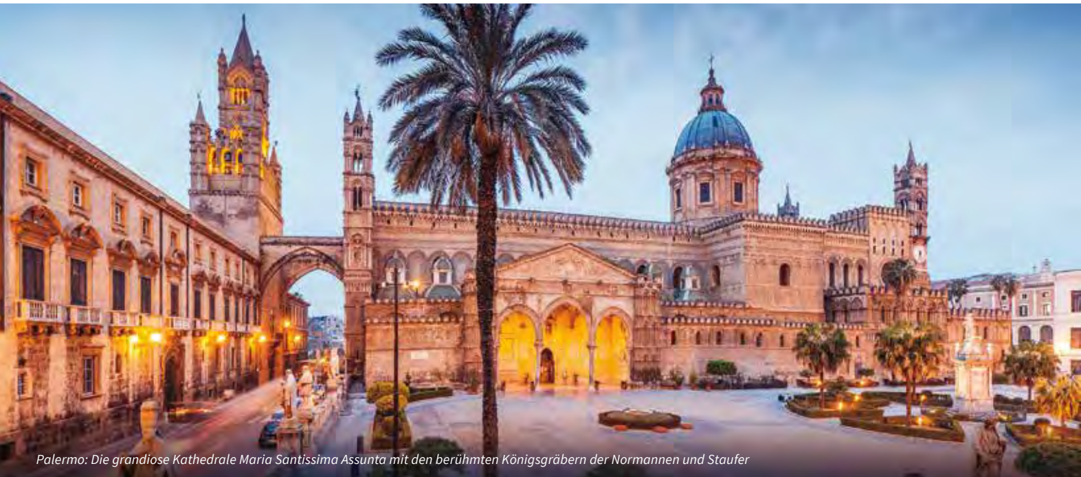
Palermo: Die grandiose Kathedrale Maria Santissima Assunta mit den berühmten Königsgräbern der Normannen und Stauer