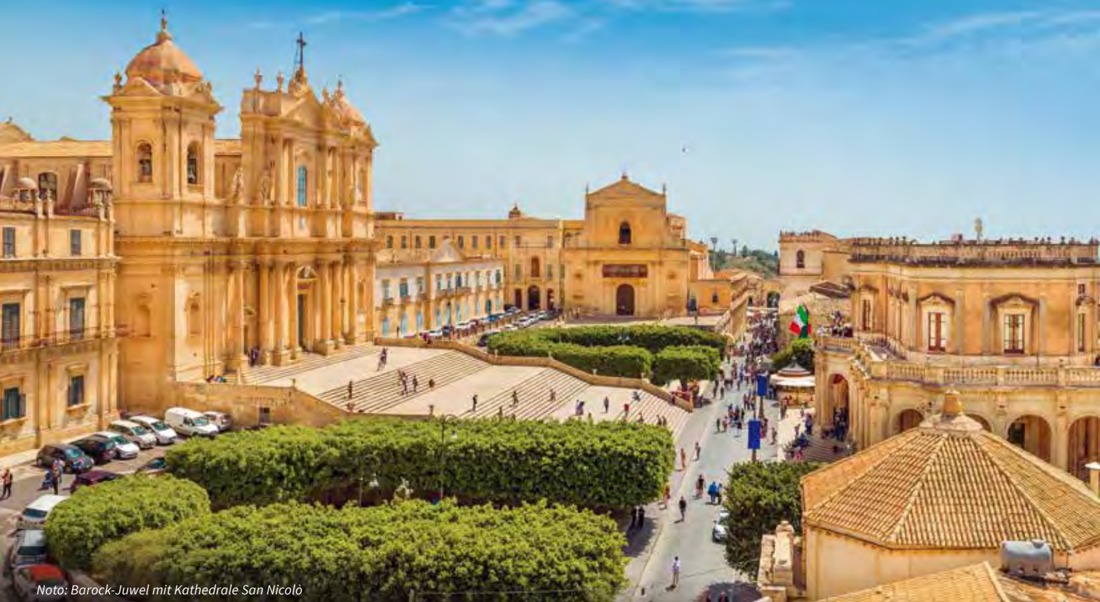
Noto: Barock-Juwel mit Kathedrale San Nicolò

Das 1890 eröffnete Theater, benannt nach dem Komponisten Vincenzo Bellini, kann sich im internationalen Wettstreit der schönsten Opernhäuser glänzend behaupten. Creme- und silberfarben sind die Stuckaturen, leuchtend rot die Sessel im Parkett unter einem einzigartig schönen Deckengemälde in bunten Farben. Im grossen Zuschauerraum in der klassischen Birnenform, vier tiefen Logenreihen und dem Loggione. Die Oper „Lucia di Lammermoor“ beginnt um 17.30 Uhr. Nach der Aufführung gemeinsames Abendessen.