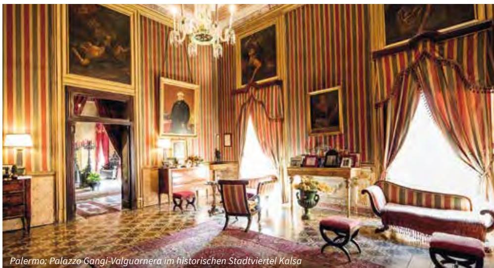
Palermo: Palazzo Gangi-Valguarnera im historischen Stadtviertel Kalsa