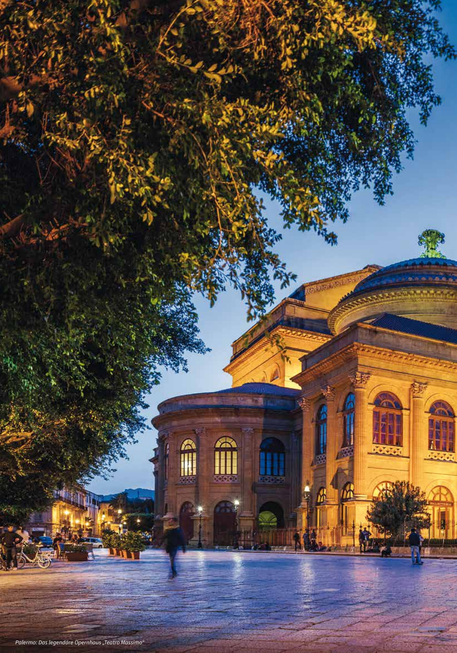
Palermo: Das legendäre Opernhaus „Teatro Massimo“