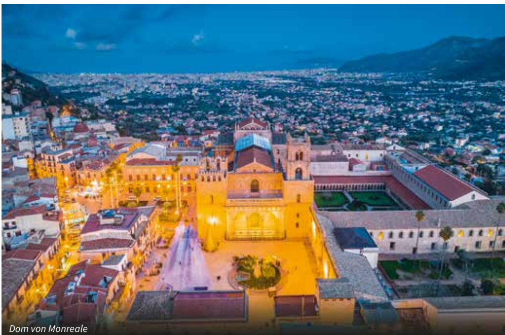
Dom von Monreale