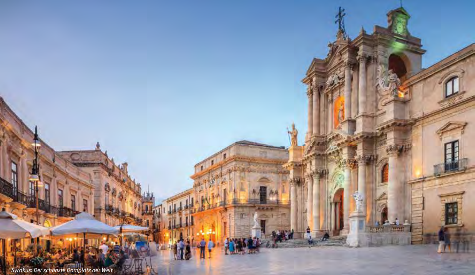
Syrakus: Der schönste Domplatz der Welt

durch die prachtvollen Räumlichkeiten und lädt uns anschliessend zum festlichen Dinner ein.