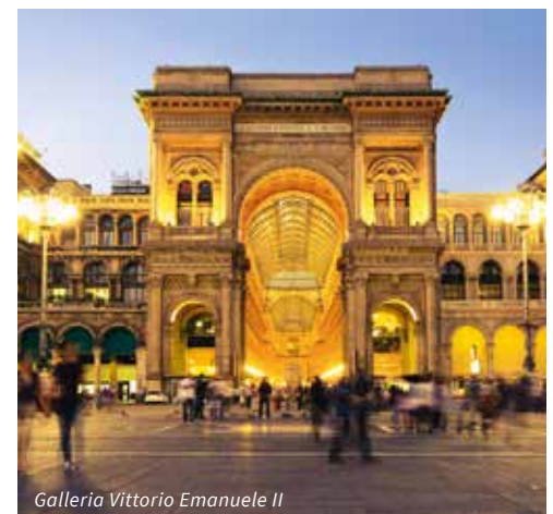
Galleria Vittorio Emanuele II