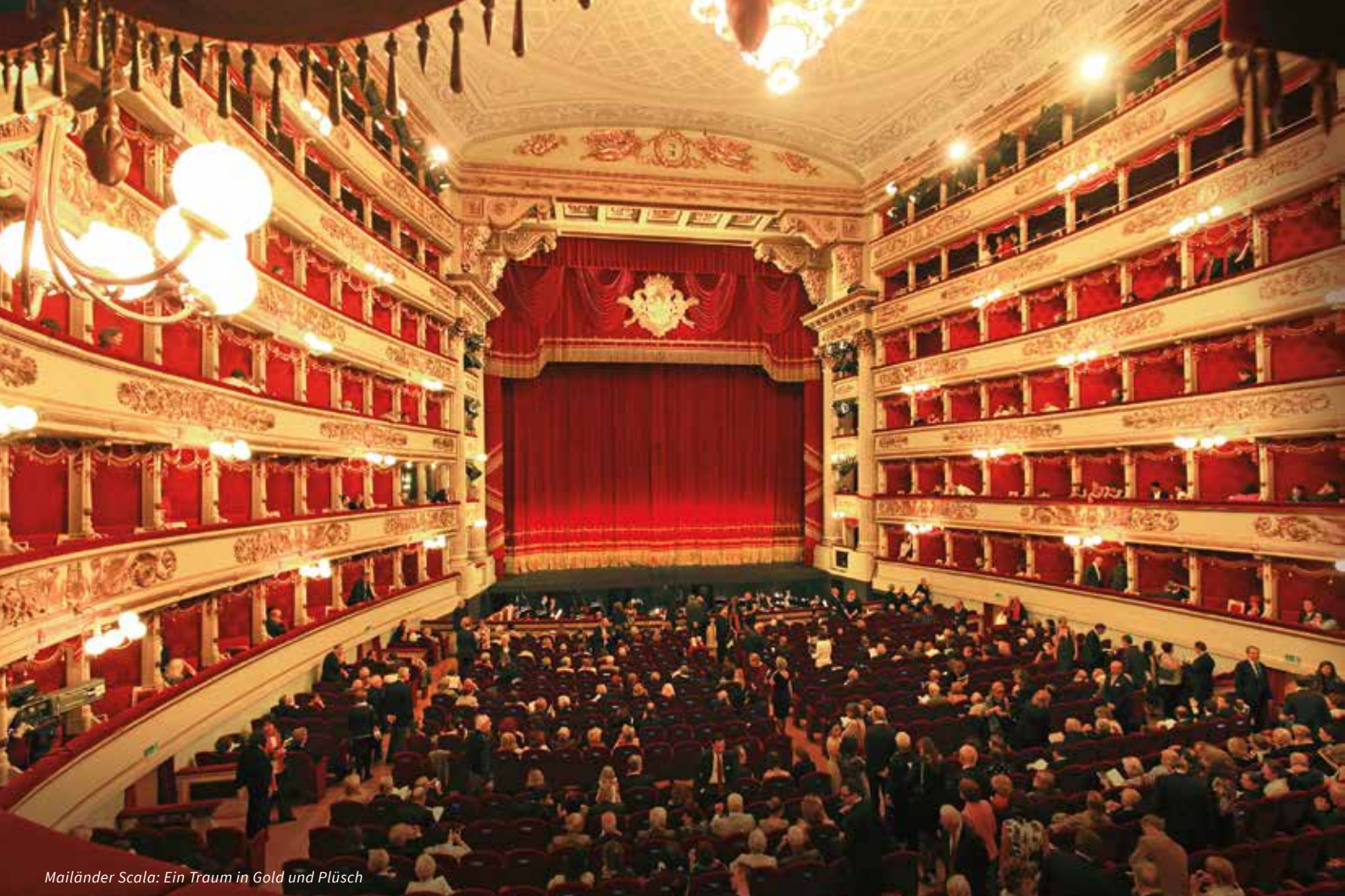
Mailänder Scala: Ein Traum in Gold und Plüsch

Allein die Fülle an Dokumenten ist beeindruckend: rund 8.000 handschriftliche Partituren, über 10.000 Libretti vom 17. bis zum 20. Jahrhundert, ca. 15.000 Briefe von Komponisten und Librettisten, über 10.000 Bühnenbildentwürfe und Figurinen, über 6.000 Fotografien, Plakate, Zeichnungen und Drucke. Einmalig! Nach der Führung haben Sie Zeit für ein individuelles Mittagessen. Der Nachmittag steht zur freien Verfügung. Am Abend treffen wir uns wieder im Hotel und geniessen unser Abendessen in einem angesagten Restaurant.