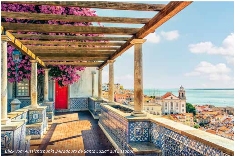
Blick vom Aussichtspunkt „Miradouro de Santa Luzia“ auf Lissabon