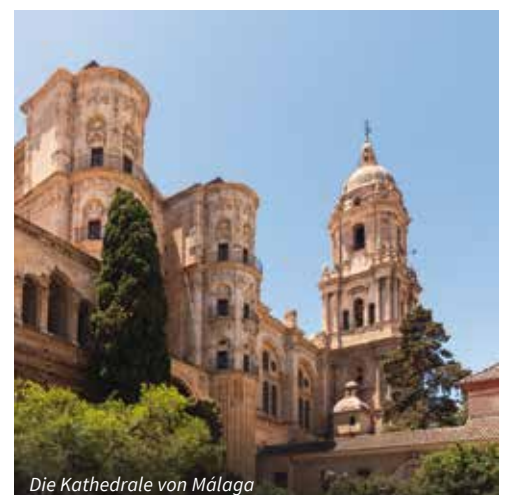
Die Kathedrale von Málaga