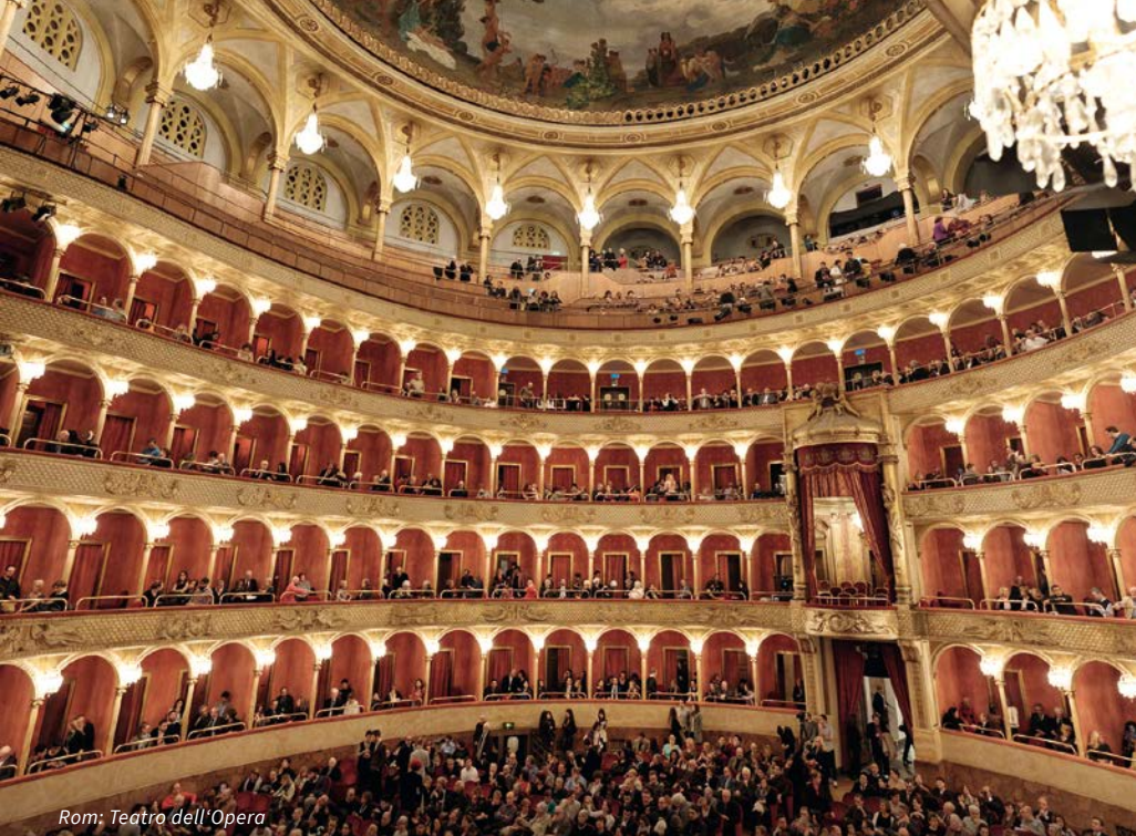
Rom: Teatro dell'Opera

ausgesuchte Highlights der Ausstellung, darunter Meisterwerke von Künstlern wie Leonardo da Vinci, Rubens, Raffael, Bernini, Caravaggio, Canova, Tizian und Bronzino. Wer möchte, kann nach der Führung im Museum verweilen. Individuelle Rückkehr ins Hotel und individuelles Mittagessen. Um 15.30 Uhr Transfer zum „Teatro dell'Opera“. Verdis „Aida“ gehört zu den beliebtesten und meistgespielten Werken des Opernrepertoires. Die Geschichte der äthiopischen Sklavin Aida, die sich am Hof des ägyptischen Königs ausgerechnet in Radames, den Heerführer gegen das eigene Volk, verliebt, inspirierte Verdi zu einer musikalischen Ausgestaltung, die ihresgleichen sucht. Zwischen Triumphmarsch und „Celeste Aida“, überwältigenden Massenszenen und intemem Liebesdrama entspinnt sich in Giuseppe Verdis