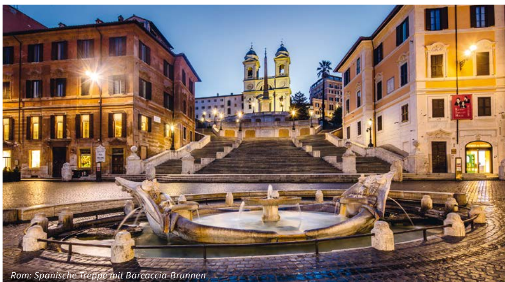
Rom: Spanische Treppe mit Barcaccia-Brunnen

Er ist zu jeder Jahreszeit der Lieblingsplatz der Römer: der „Kulturpark“ der Villa Borghese. Wenn die Sonne scheint, strömen alle in die romantische Parkanlage und flanieren zwischen Magnolien und Pinienbäumen, Wiesen und kleinen Seen. Unser Ziel heute Vormittag ist eine der bedeutendsten Gemäldegalerien Italiens: Die „Galleria Borghese“. Ein Kunstexperte zeigt uns