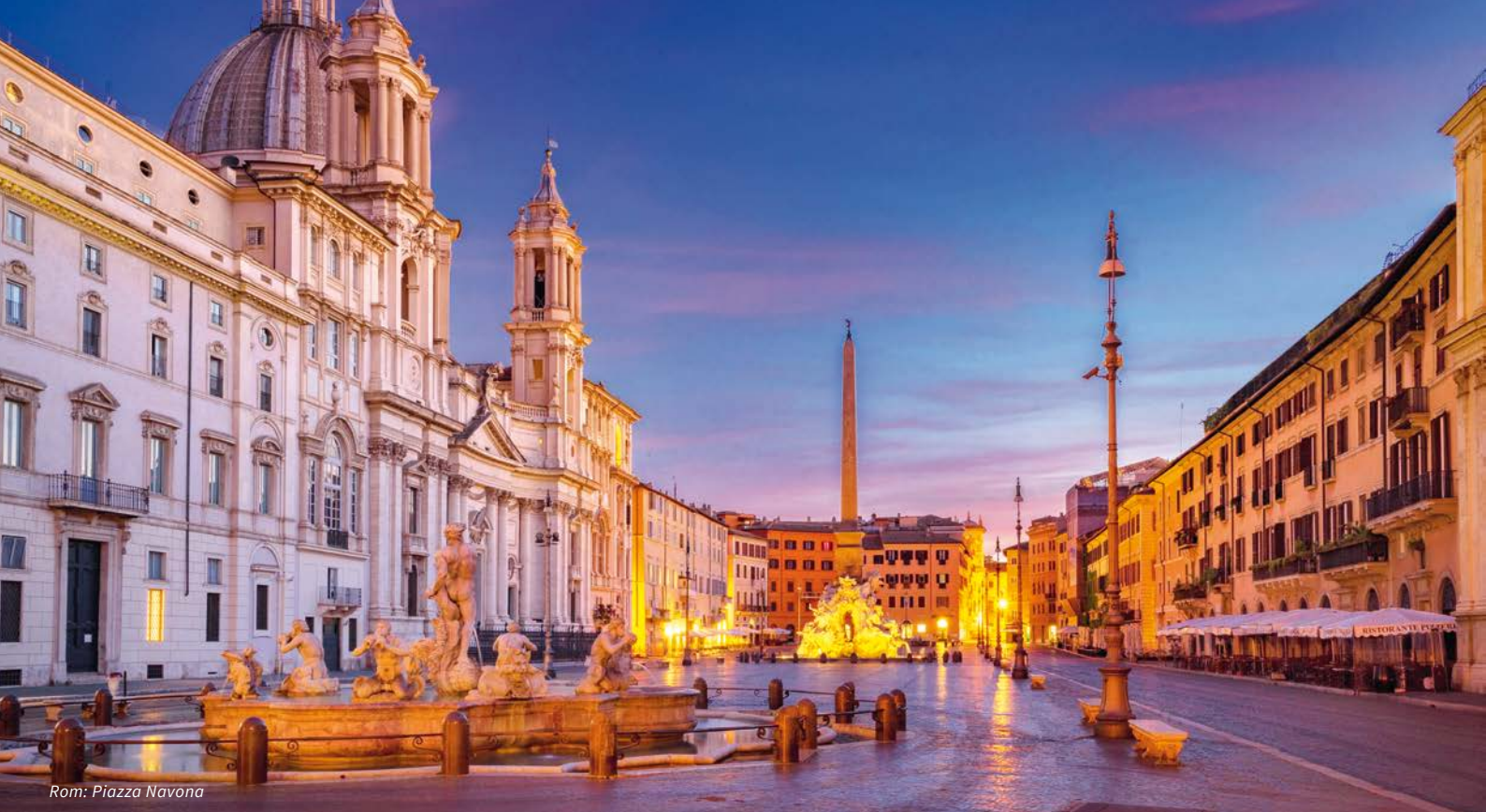
Rom: Piazza Navona

Freuen Sie sich heute auf ein Überraschungs- und Spezialprogramm im Kirchenstaat, welches Peter Blome speziell für uns zusammengestellt hat. Durch seine ausgezeichneten Beziehungen wird er uns heute Türen öffnen, welche für die meisten Besucher verschlossen bleiben. Seien Sie gespannt! Weil wir uns Zeit lassen wollen für die heutigen Besichtigungen, werden wir erst gegen 14.00 Uhr ein leichtes Mittagessen geniessen und anschliessend zum Hotel zurückfahren. Es bleibt Zeit zum Ausruhen oder für individuelle Unternehmungen. Um 18.30 Uhr treffen wir uns wieder im Hotel, zelebrieren in den stilvollen Räumlichkeiten einen typisch-italienischen Aperitivo und fahren anschliessend ein zweites Mal zum Konzertsaal „Auditorium Parco della Musica“. Das Konzert mit Igor Levit beginnt um 20.30 Uhr.