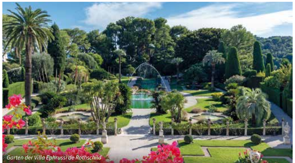
Garten der Villa Ephrussi de Rothschild

werden zu lassen. Sie überwachte die Arbeiten, für die im Stil der italienischen Renaissance erbaute Villa persönlich, wobei sie nicht weniger als zwölf Architekten zur Verzweiflung getrieben haben soll. Die stilvollen Räumlichkeiten sind angefüllt mit erlesenen Einzelstücken, vorzugsweise aus dem 19. Jahrhundert. Im Schlafzimmer lassen seidene Bettdecken, handbestickte Negligés und golddurchwirkte Wandbespannungen jenen Luxus erahnen, mit dem sich Madame Rothschild zu umgeben pflegte. Besonders faszinierend ist die sieben Hektar grosse Gartenanlage, deren einzelne Abschnitte verschiedene Stilrichtungen der Gartenbaukunst widerspiegeln. Nach einem feinen gemeinsamen Mittagessen fahren wir nach Nizza, um im weltberühmten Gesamtkunstwerk – dem Hotel „Negresco“ unsere Zimmer zu beziehen. Am Abend erwartet Sie entweder ein feines Dinner oder eine Konzert- oder Opernvorstellung in Nizza oder Monte Carlo. Auch hier lag zum Zeitpunkt der Drucklegung der Spielplan noch nicht vor. Wir verweisen nochmals auf das Sonderkästchen „Musikprogramm“.