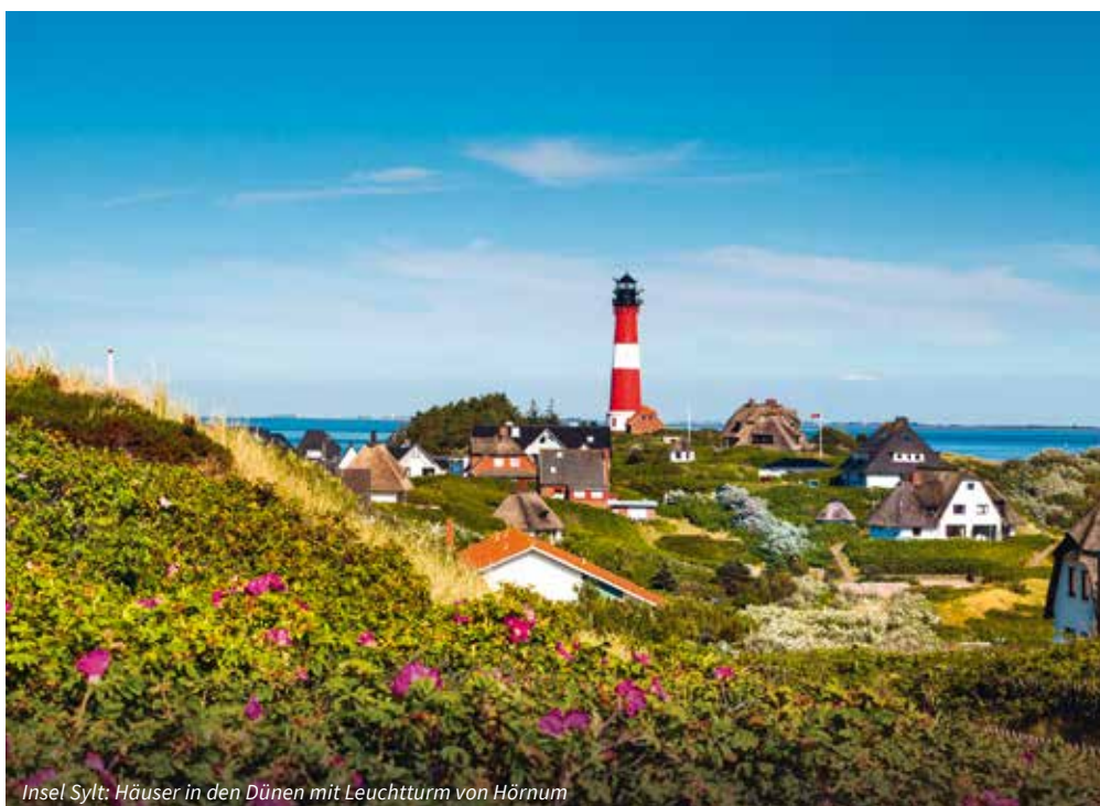
Insel Sylt: Häuser in den Dünen mit Leuchtturm von Hörnum