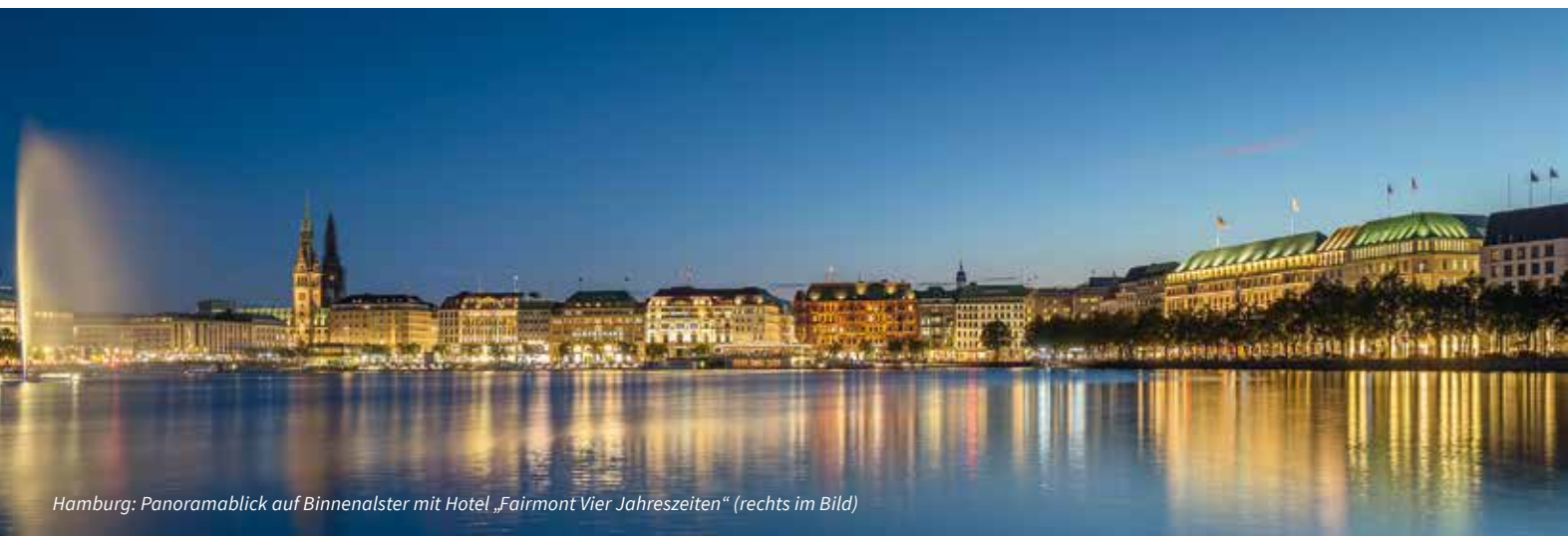
Hamburg: Panoramablick auf Binnentaler mit Hotel „Fairmont Vier Jahreszeiten“ (rechts im Bild)

„Erlebnisse der Grönlandfahrer von Föhr und das Leben der Wale heute.“