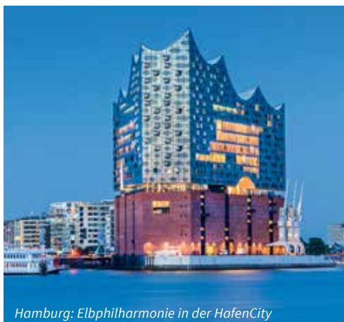
Hamburg: Elbphilharmonie in der HafenCity

Brücken, Kanäle und imposante Backsteingebäude, die sich im Wasser spiegeln: Zwischen Deichtorhallen und Baumwall liegt im nordöstlichen Teil des Hamburger Hafens ein architektonisch und historisch besonders interessantes Viertel – die Speicherstadt. Der weltgrößte zusammenhängende Lagerhauskomplex entstand Ende des 19. Jahrhunderts und wird geprägt