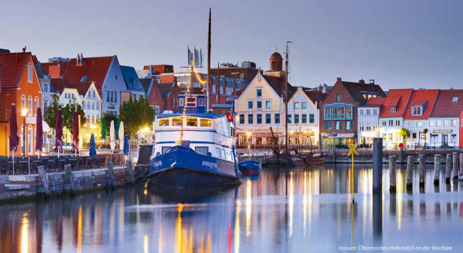
Husum: Charmantes Hafenedyll an der Nordsee

In zwei Etappen geht es nach Sylt: Um 10.15 Uhr bringt uns der Katamaran MS „Adler Rüm Hart“ nach Amrum (Ankunft Amrum um ca. 11.00 Uhr) und im Anschluss fahren wir mit der MS „Adler-Express“ weiter nach Sylt. Zielhafen unserer Tour auf der Insel ist Hörnum, wo wir um ca. 11.50 Uhr ankommen werden. Mit dem Bus geht es weiter, erst zum Mittagessen und anschliessend zu einer grossen Inselrundfahrt. Natürlich kommen wir auch am bekannten Ferienort Kampen vorbei, werfen einen Blick auf das grossartige Naturschauspiel der Wanderdünen und unternehmen einen Spaziergang durch das idyllische Keitum – für viele das schönste Dorf der Insel. Welches ist das älteste Haus der Insel und wieviel hat das teuerste Haus gekostet? Wie viele Schafe leben auf Sylt? Wann wütete die letzte Sturmflut und wieviel Land verliert die Insel jedes Jahr? Freuen Sie sich auf spannende Syltgeschichten, lustige Anekdoten und echte Geheimtipps. Nach einem Tag voller Erlebnisse geht es um 17.15 Uhr wieder