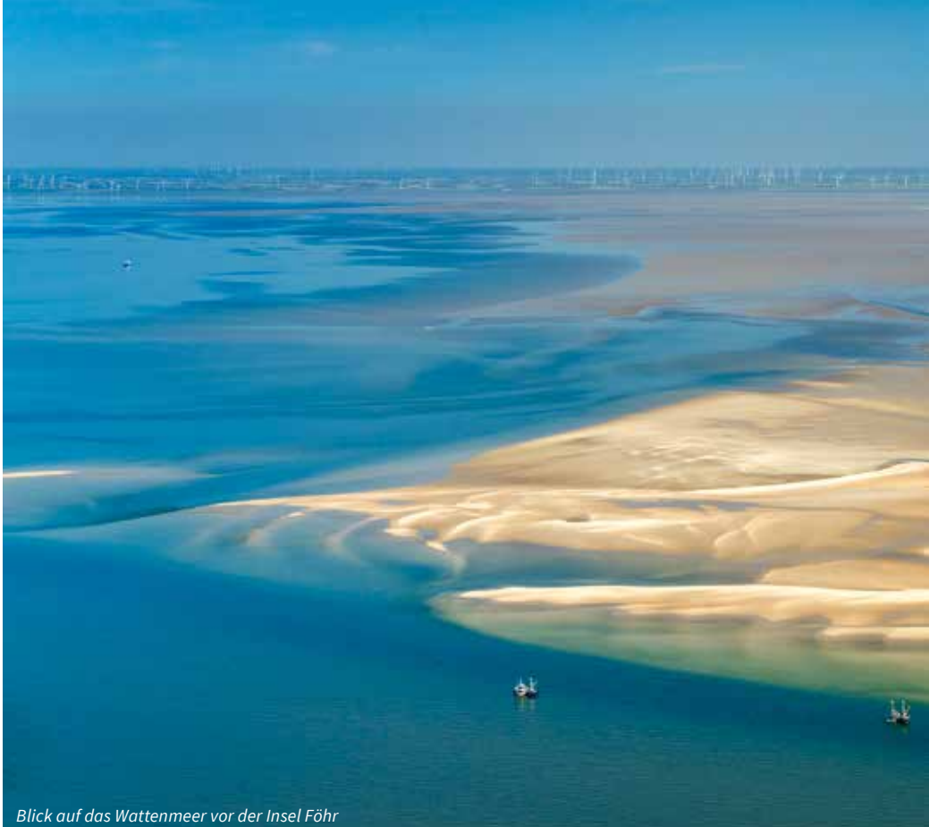
Blick auf das Wattenmeer vor der Insel Föhr

von wilhelminischer Backsteingotik der Gründerzeit mit schönen Giebeln, Erkern und Türmen. Wir beginnen den heutigen Tag mit einem Spaziergang durch das weltberühmte UNESCO-Weltkulturerbe. Über das Kontorhausviertel (ebenfalls UNESCO-Weltkulturerbe) gehen wir anschliessend wieder zurück Richtung Innenstadt. Individuelles Mittagessen. Der Nachmittag steht zur freien Verfügung. Um 16.30 Uhr treffen wir uns wieder im Hotel und gehen hinüber zum Alsteranleger „Jungfernstieg“. Denn: Nicht mit dem Bus wollen wir heute zur Elbphilharmonie fahren, sondern wir haben uns, so wie es sich für DIVERTIMENTO Kulturreisen gehört, für eine ganz besondere Anreise zum Konzerthaus entschieden: Per Boot! Mit einem exklusiv für DIVERTIMENTO Kulturreisen gecharterten Alsterschiff geht es durch schmale Fleete, unter zahlreichen alten und neuen Brücken hindurch kreuz und quer durch die historische Speicherstadt gemächlich und entspannt Richtung Elbphilharmonie. Natürlich haben wir an Bord auch für das leibliche Wohl gesorgt und servieren Ihnen wäh-